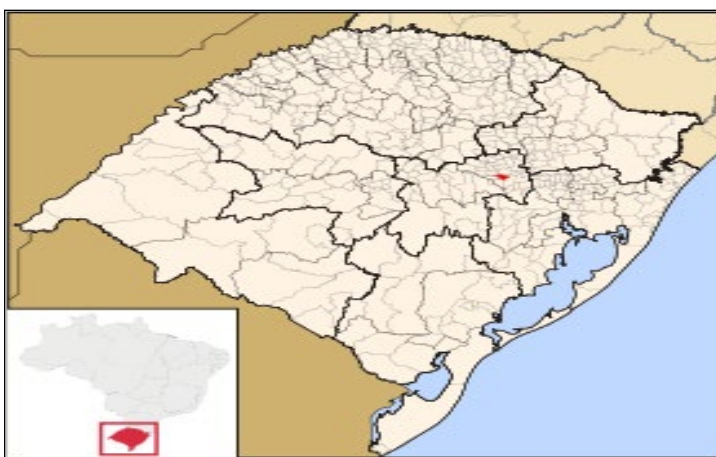
Imagem N° 1: Mapa do Rio Grande Do sul 4

Lajeado es una de ciudad que se encuentra en el Valle del Taquari 3 , en el Estado de Rio Grande do Sul (RS). Su organización socio-espacial, está formada por más de 20 barrios, tales como: San Cristóbal, Alto del Parque, San Antonio, Morro 25, San Benedicto, entre otros; los cuales están atravesados por el rio Taquari, antiguo canal de comunicación entre el interior del Valle del Taquari con la capital del Estado, Porto Alegre. El Estado del Rio Grande del Sur, limita al nor-occidente con Argentina, al sur-occidente con Uruguay, al norte con Estado de Santa Carina y al oriente con el Océano Atlántico