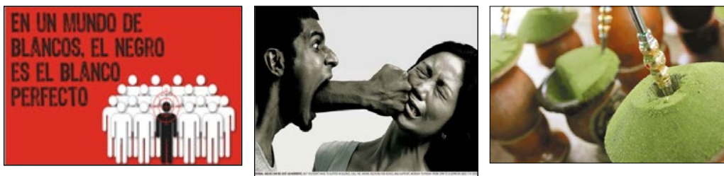
Imagen N° 3: Figuras motivadoras de saberes 18 .

Para que exista una tradición es necesario tener presente la existencia de preconceptos. Los preconceptos son ideas, acciones, formas de hablar, en fin, las cosas que a veces hacemos en nuestra vida diaria. Lo importante es preguntarnos sobre la legitimidad de ellas en nuestras vidas, por ejemplo: por qué tenemos que casarnos jóvenes? Por qué tenemos que tomar o comer tal comida? hablaremos brevemente de ellos.