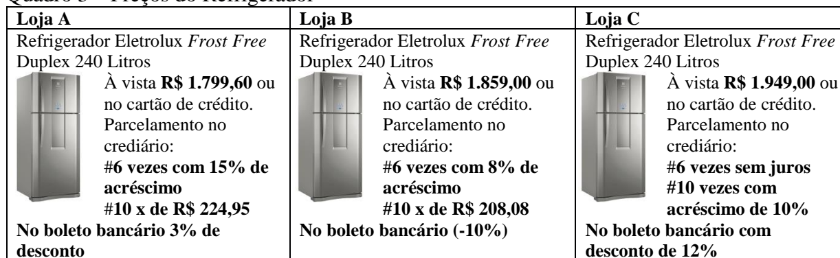
Quadro 3 – Preços do Refrigerador