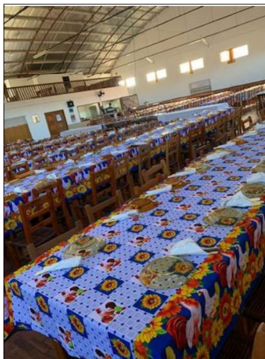
Figura 2: Salão da Comunidade Evangélica do Trombudo preparado para dia de festa